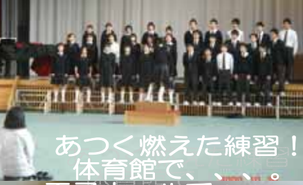
あつく燃えた練習! 体育館で、...。王子ホールで、...