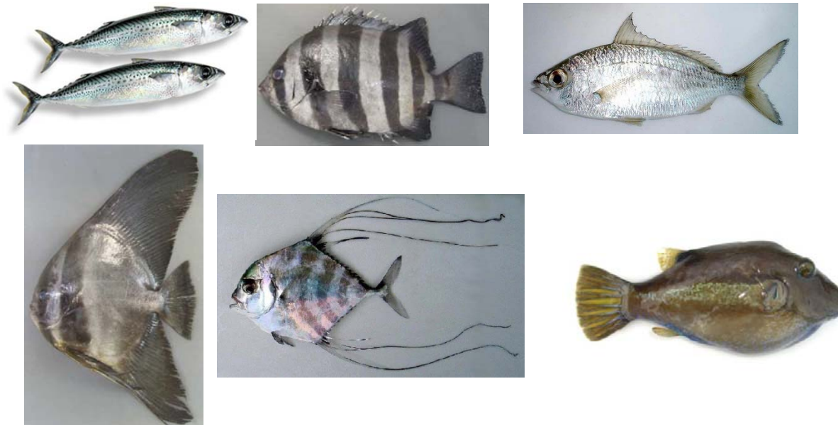
(右上から)サバ イシダイ クロサギ ツバメウオ イトヒキアジ キタマクラ・・・他多数の魚