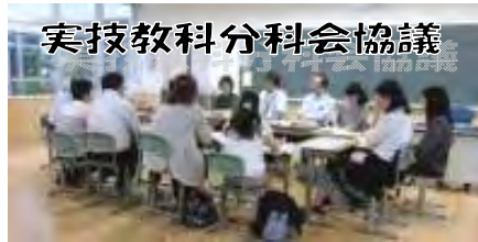
実技教科分科会協議